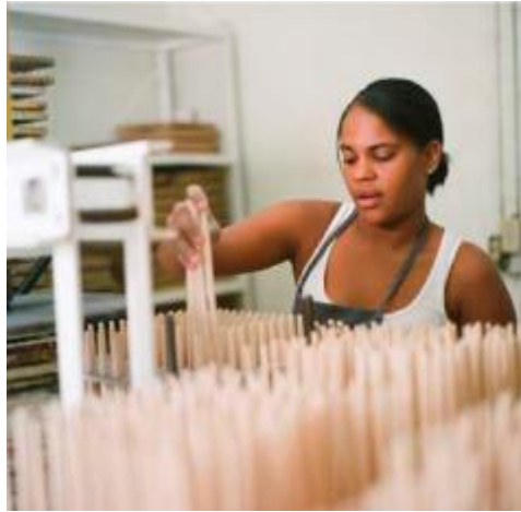
Расстановка кистей в щиты для их последующей проклейки, покраски и лакирования.

Создание лакированной ручки будущей кисти – непрерывный процесс. С помощью различных видов разбавителей и других ингредиентов подготавливают лаковую смесь необходимой вязкости.