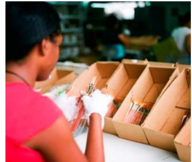
Готовые кисти упаковываются и отправляются по всему миру.