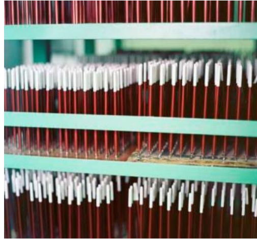
Перевернутые доски уже с несколькими слоями лакокрасочной смеси сушатся и ждут следующего шага