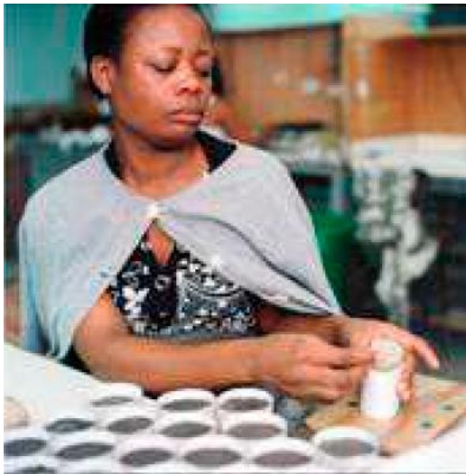
Подготовка пучков волос после машинного смешивания.

Весь ворс взвешивают и разделяют на отдельные порции готовые к смешению в пучки на специальной машине, которая сортирует килограмм высококачественного сырья за один час. Затем в ручную волосы формируют в отдельные пучки, которые передаются мастерам для изготовления. На одном конце каждого волоса или волокна есть только точка, и важно, чтобы все волосы указывали в одном направлении! Любые волосы, которые перевернуты, являются липкой лентой.