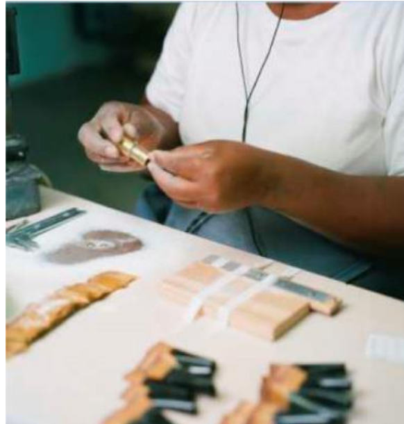
Удаление лишнего ворса при вставке в формовочную чашку

Пучки ворса вставляются в форму, а затем сформированные пучки выводятся из чашки и вставляются в наконечник и вытягиваются, чтобы исправить длину, иными словами отрегулировать длину выставки. Затем сформированные головки аккуратно регулируются пальцами обученного мастера.