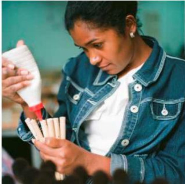
Добавление клея к кончику ручки кисти перед прикреплением вручную ворса и последующем создании кисти во «Французской» обойме

Это очень важный этап в производственном процессе. Мастер подбирает точно необходимое количество волосков (ворса). Подбирает и формирует открытый пучок и укладывает на стол к остальным пучкам лежащим в одном направлении. Позже пучок один за другим вставляются в формовочные чашки обращенные вниз. Форма каждой формовочной чашки отличается по типу формируемой в дальнейшем кисти, плоская или круглая. Сформированные пучки подвешивают для дальнейшего добавления эпоксидного клея в свободное отверстие металлической обоймы для закрепления пучка. Теперь пучки закреплены в обойме и готовы к дальнейшим ступеням производственного процесса.