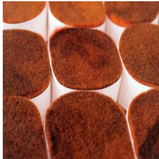
Связки готовой смеси ворса разной длинны и толщины.