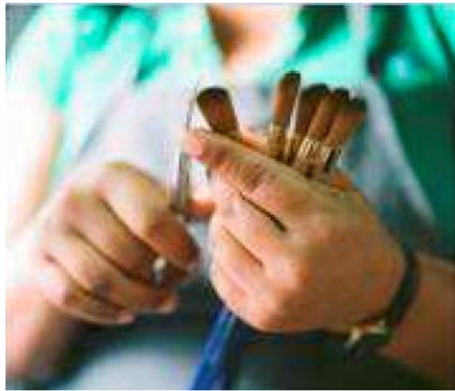
Уже обжатые кисти, проходят этап ручной отделки, вручную обрезаются и корректируются.