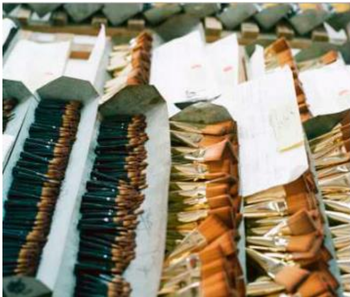
Готовые пучки вставленные в обойму