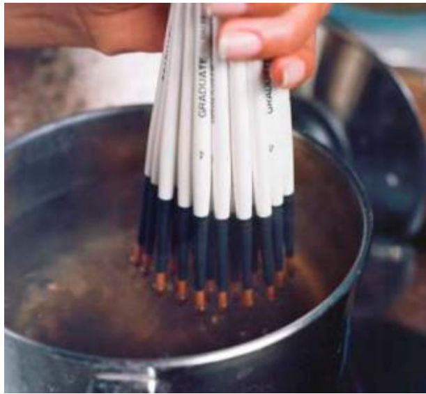
Кисти, погружаются в раствор аравийской камеди (гуммиарабика).

Отделка состоит из ручного вычесывания любых искривленных и не закрепленных волос или тонкого пуха, а также тонкой ручной отделки формирования пучка кисти. Наконеч, кисти погружают в раствор аравийской камеди (гуммиарабик) и придают форму для каждой кисти в отдельности. Готовые продукты затем упаковываются для отправки и распространения нашим партнерам.