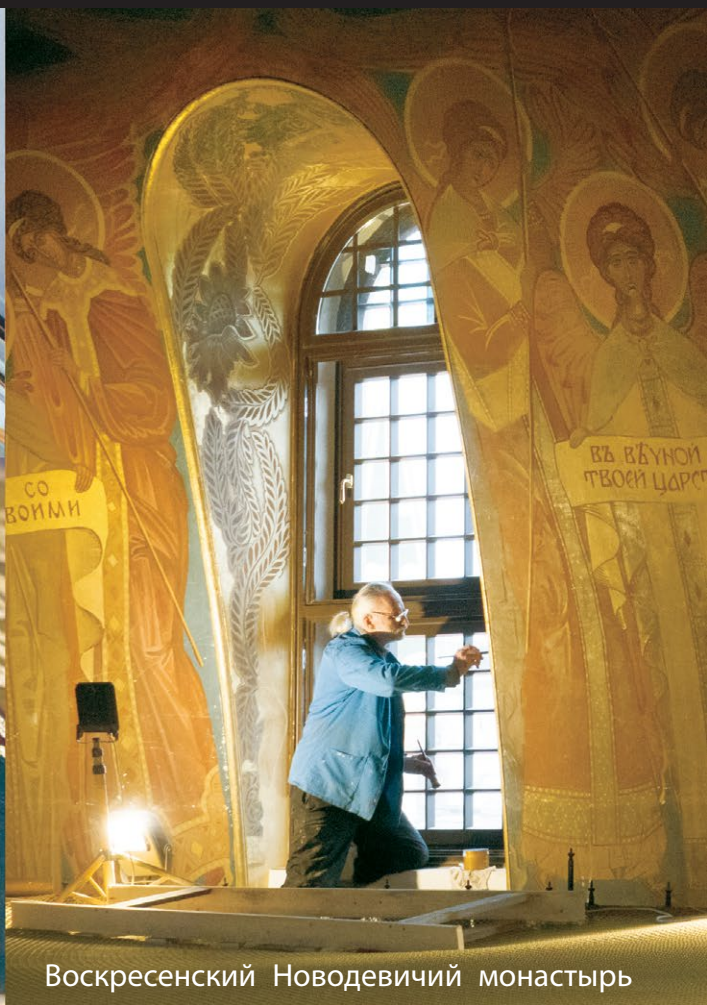
Воскресенский Новодевичий монастырь