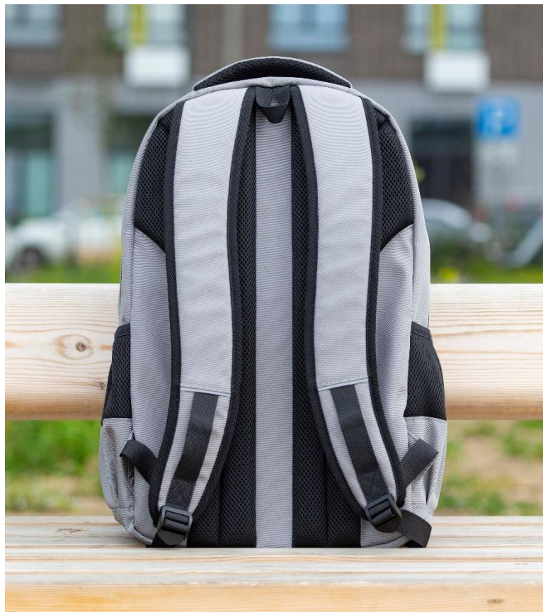
ЭРГОНОМИЧНАЯ ВЕНТИЛИРУЕМАЯ СПИНКА С МЯГКИМИ ВСТАВКАМИ

Удобная посадка за счет широких мягких лямок и эргономичной вентилируемой спинки с мягкими вставками. Два вместительных отделения, основное с защитным карманом для ноутбука с экраном до 15 дюймов, второе с вместительным карманом на молнии для документов. Светоотражающие элементы, кроме основной ручки есть маленькая петля для подвеса. Внешние карманы расположены не только по бокам, но и на передней части для быстрого доступа для телефона и прочих важных аксессуаров.