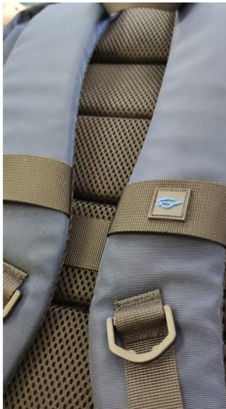
ПЕТЛЯ ДЛЯ ОЧКОВ