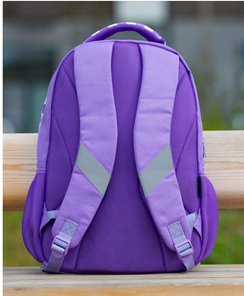
ПЕТЛЯ ДЛЯ ПОДВЕСА

Два больших отделения, основное с защитным карманом для планшета или другого гаджета.