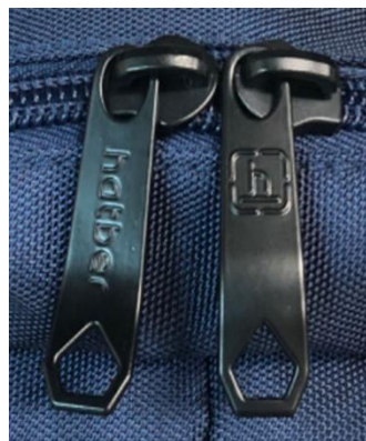
ДВОЙНЫЕ БЕГУНКИ С ОТВЕРСТИЯМИ ДЛЯ КОДОВОГО ЗАМКА